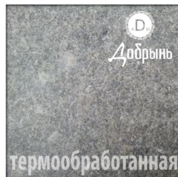
ТМ «GALANT NERO DOBRYN»