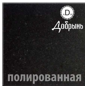
ТМ «GALANT NERO DOBRYN»