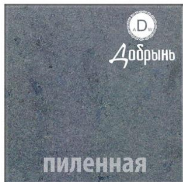
ТМ «GALANT NERO DOBRYN»